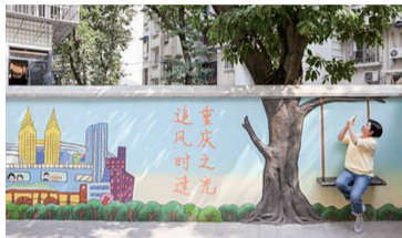
和雅苑居民在彩绘墙旁拍照

大礼堂片区城市功能品质提升项目位于渝中区上清寺街道，东至人和街，南至巴蜀中学，西至三峡博物馆，北至人民路，总占地面积52.8万平方米。