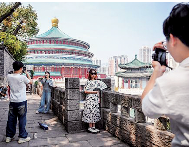
马鞍山传统风貌区，游客在此合影。