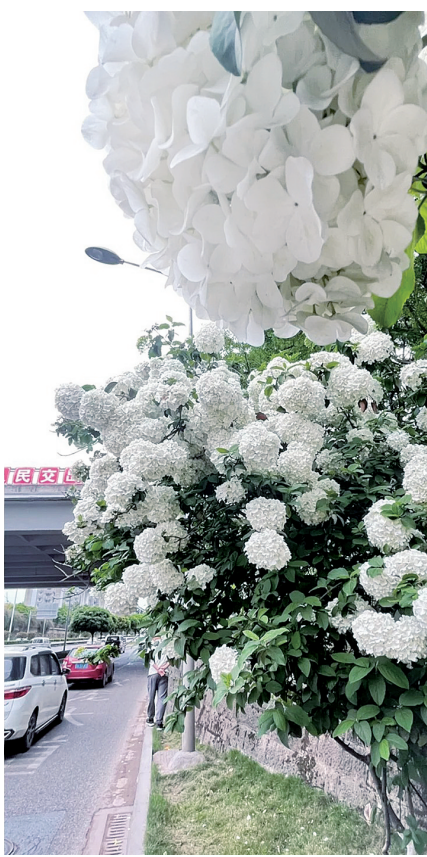
网友拍摄的木绣球真美