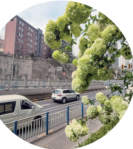
江北区海尔路木绣球竞相绽放

人间四月芳菲至，最近，重庆街头木绣球花开正盛，惊艳了无数市民游客。从蓝花楹到木绣球，从紫叶李到美人梅，重庆城市绿化为何频频“出圈”？