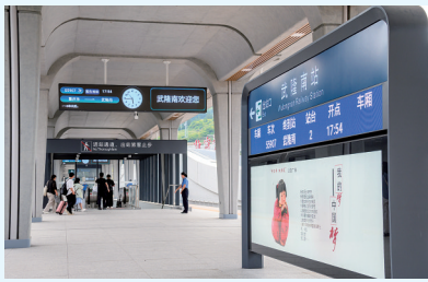
高铁列车抵达武隆南站

务。后续还将根据客流变化,动态增开高铁站至其他景区的旅游专线,不断完善“快进慢游”的交通网络,助力游客轻松畅游南川美景。