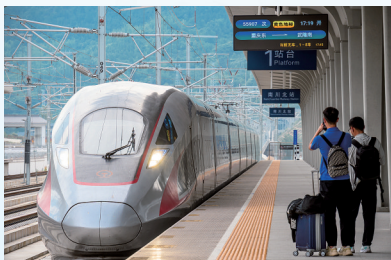
采访团从重庆南川北站高铁站出发

坐直通车: 目前已开通至金佛山西、金佛山北、神龙峡的旅游直通车,为游客提供一站式直达景区的便捷服