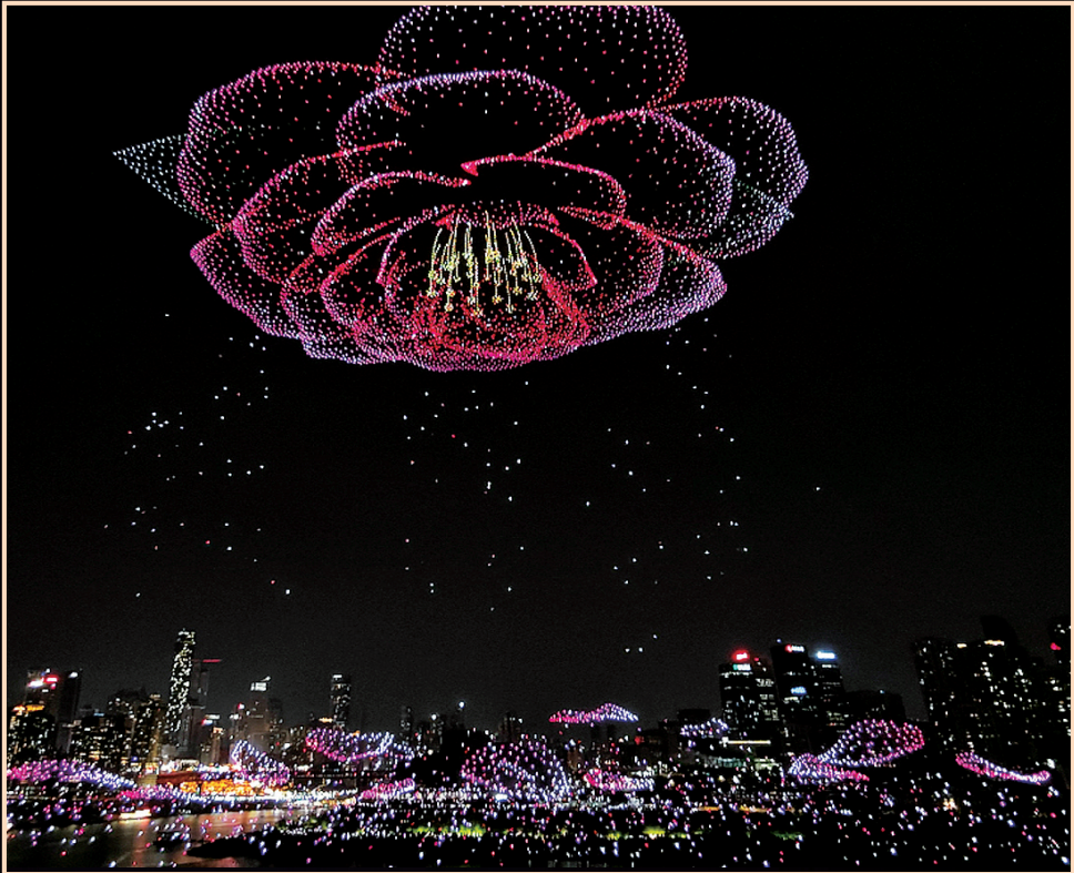
▲無人機在夜空中綻放出巨大的山茶花

在重慶挑戰吉尼斯世界紀錄稱號“最多無人機組成的空中圖案”，重慶衛視無人機執飛團隊負責人揭示了籌備中的核心難關：複雜地形通信覆蓋、雙編隊飛行模式創新、高低空動態變換。 “這不僅是一次技術挑戰，更是一次城市形象的集中展示。”團隊表示，“我們希望通過這場融合頂尖科技與深厚文化的表演，以科技為筆、文化為墨，向世界呈現重慶‘六區一高地’的建設成果，並為全球低空經濟與文旅產業融合貢獻‘重慶方案’。”