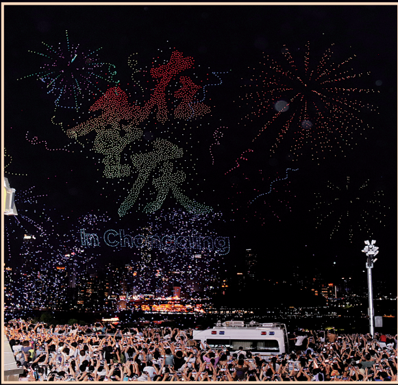
◀夜空中的城市印章