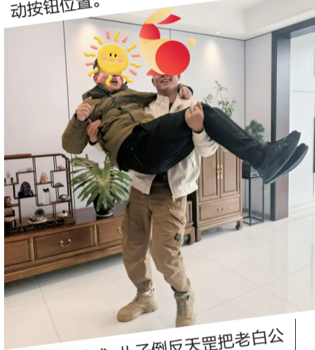
父子游戏，儿子倒反天罡把老白公主抱，举高高。

记者连线小白，老白刚和他复盘完这次救人细节，总结经验。“民警说遇到类似情况，应该先按下扶梯上下两端的红色紧急制动按钮，同时呼叫站台工作人员，救