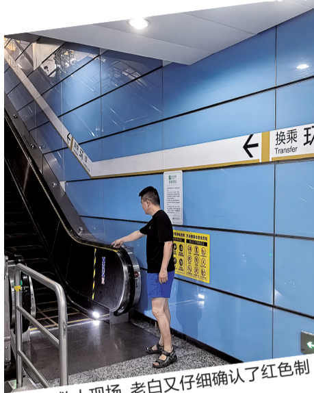
在救人现场，老白又仔细确认了红色制动按钮位置。

7月15日下午，重庆轨道交通五里店站警务室内，55岁的老白将身份证轻轻放在桌上，反复确认后，忐忑开口。这位在扶梯上救下一对摔倒男女的父亲，索要监控视频只为向儿子证明，“看，你老汉还是可以，是个男子汉！”