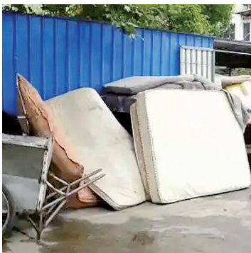
被丢弃在小区的大件废旧家具

近年来，浙江省嘉兴市针对再生资源回收行业准入门槛低、全品类回收难等问题，采取了体系构建、激励参与、规范运作的策略，初步实现了再生资源回收体系“一张网”。这一体系以3个区级分拣集散中心为核心，6个镇级分拣中心和23个网点为支撑，覆盖了废塑料、废金属、废橡胶等七大类以及塑料包装物、饮料瓶、纸质包装物等26小类再生资源的全品类回收。 据央视