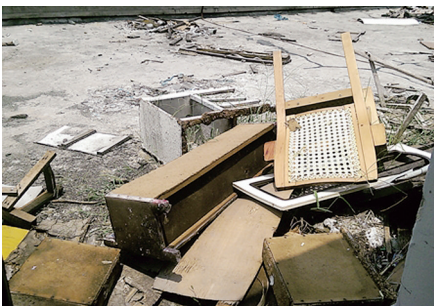
堆放在楼顶的旧家具

记者了解到，北京市各个区均设有垃圾渣土消纳中心。北京市一家物业公司的相关负责人对