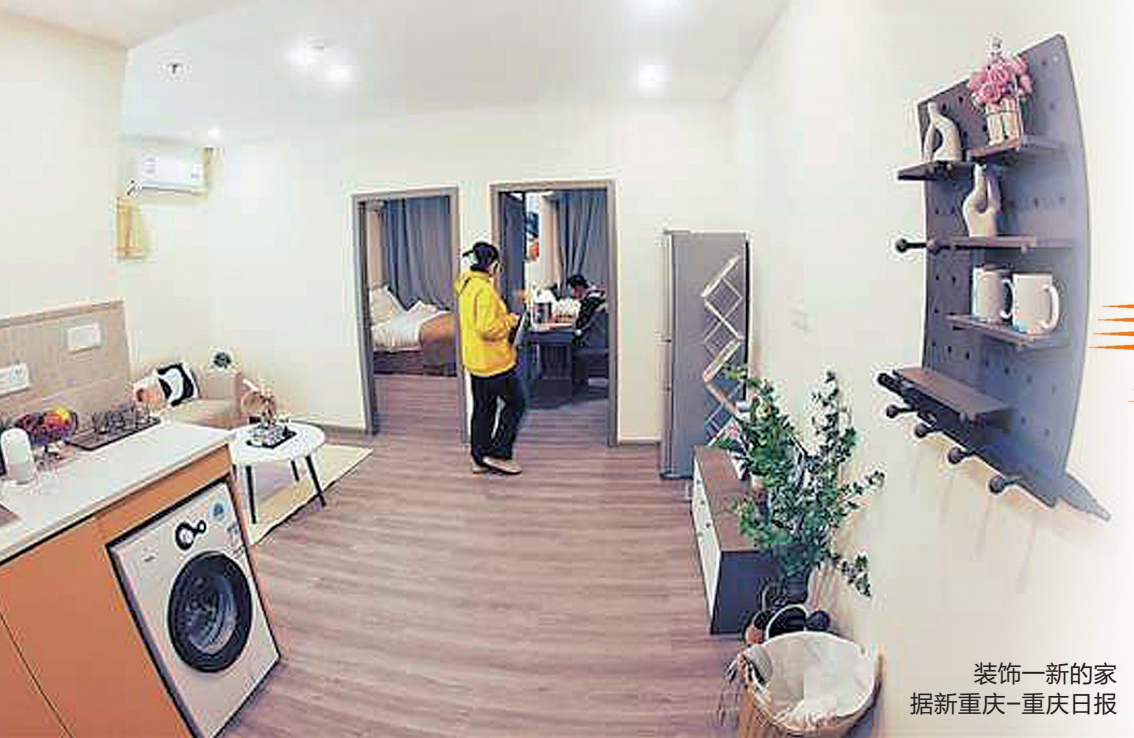
装饰一新的家 据新重庆-重庆日报