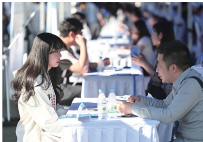
“公共就业服务进校园”活动现场