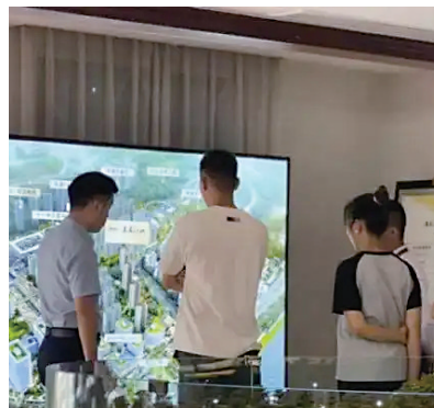
市民在美心·美岸江山项目看房