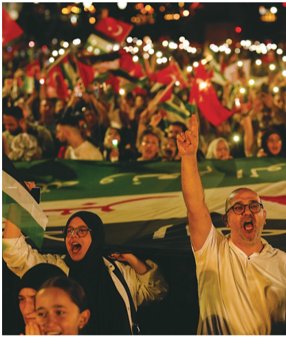
8月9日,土耳其民众在伊斯坦布尔集会声援加沙。