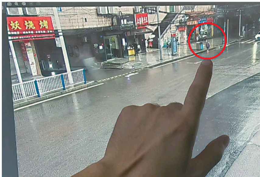
民警在视频中找到走失的老人

重庆晨报 民生在线 扫码关注 难事、烦事、委屈事、不平事、 新鲜事告诉我们，记者帮你办