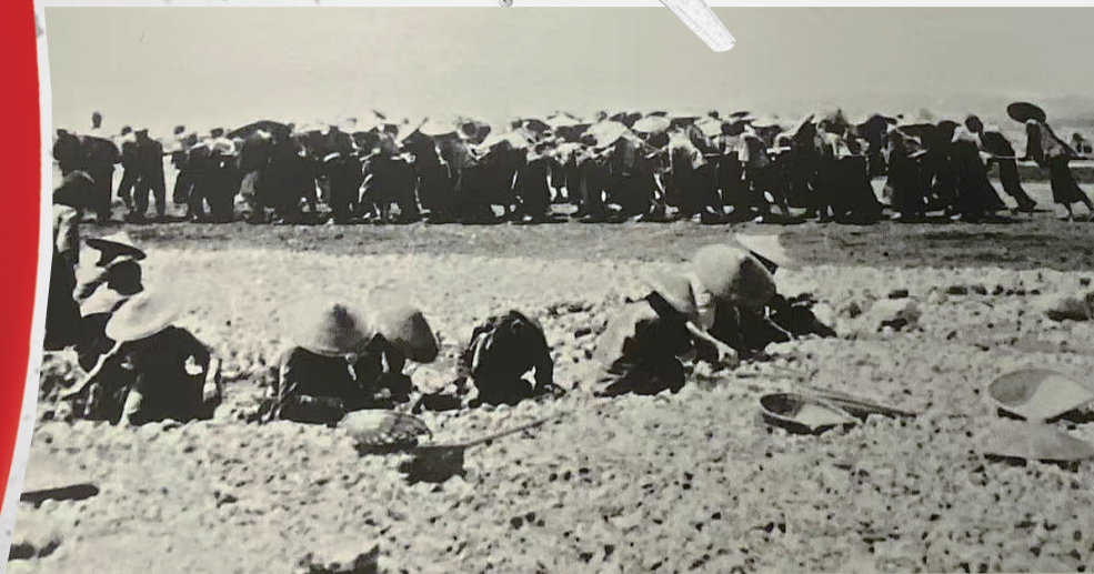
重庆数万军民对梁山机场进行扩建