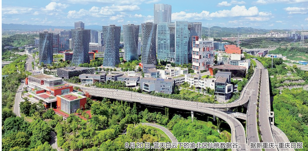
8月20日,蓝天白云下的渝北区仙桃数据谷。 据新重庆-重庆日报