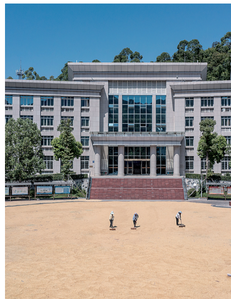
人们在红炉镇政府广场上晾晒粮食