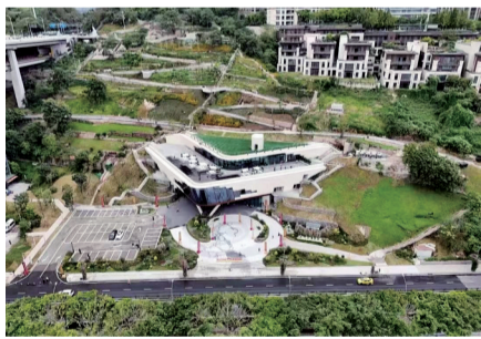
江北城川江航运文化园

这座文化园由民生机器厂旧址蝶变而来，通过山城步道串联室内展览、室外公园、地下防空洞，将川江之险绝、航运之发展融入建筑设计，打造城市中的“立体川江图”。让川江航运的故事在这里