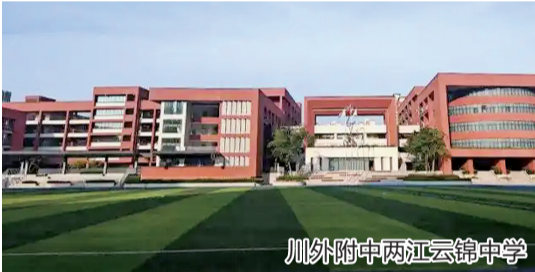
川外附中两江云锦中学