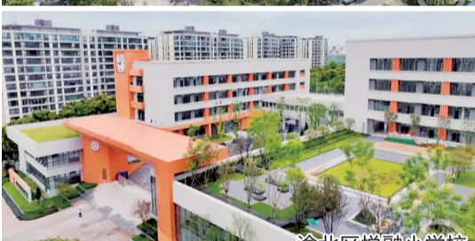
渝北区悦融小学校