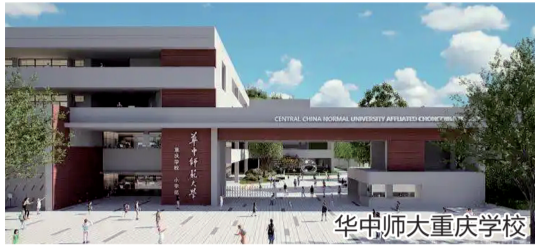
华中师大重庆学校