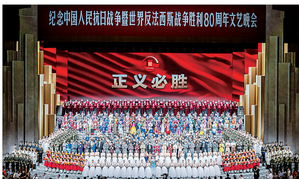
9月3日晚，纪念中国人民抗日战争暨世界反法西斯战争胜利80周年文艺晚会《正义必胜》在北京人民大会堂隆重举行。