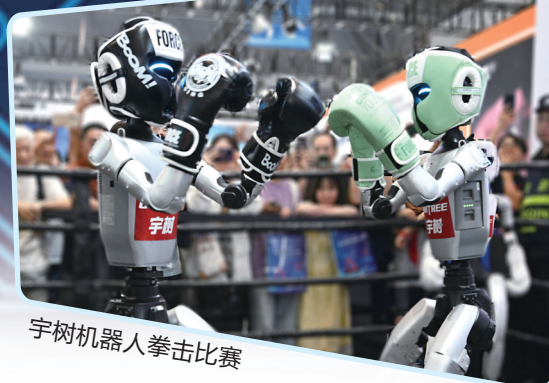
宇树机器人拳击比赛