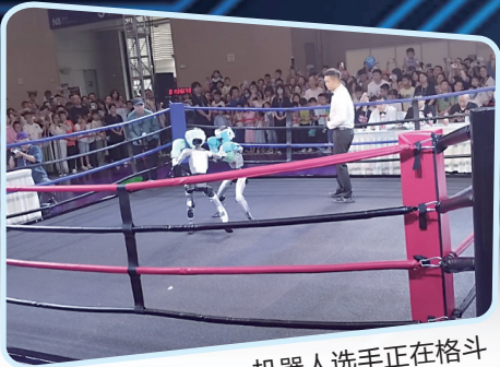
机器人选手正在格斗