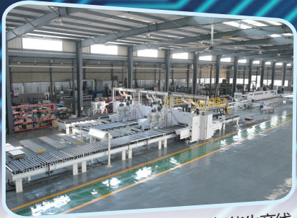
西南铝业公司铝深加工智能生产线