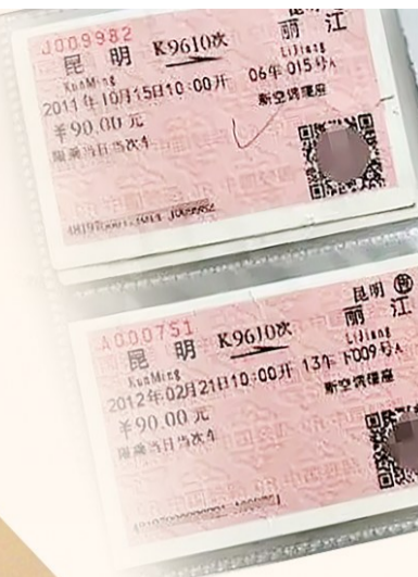
网友晒出的纸质火车票

近日，“纸质火车票将正式退出历史舞台”的话题登上微博热搜第一，引发网友关注。根据铁路部门规定，今年10月1日起，纸质报销凭证将全面停用，由电子发票取代，铁路客运全面进入无纸化时代。网友们纷纷感叹“有点遗憾”，也有人担心此举对不用智能手机的老人不方便，认为应该提供多种选择而不是“一刀切”。更多的网友发起一波“回忆杀”，纷纷晒出自己的纸质火车票。