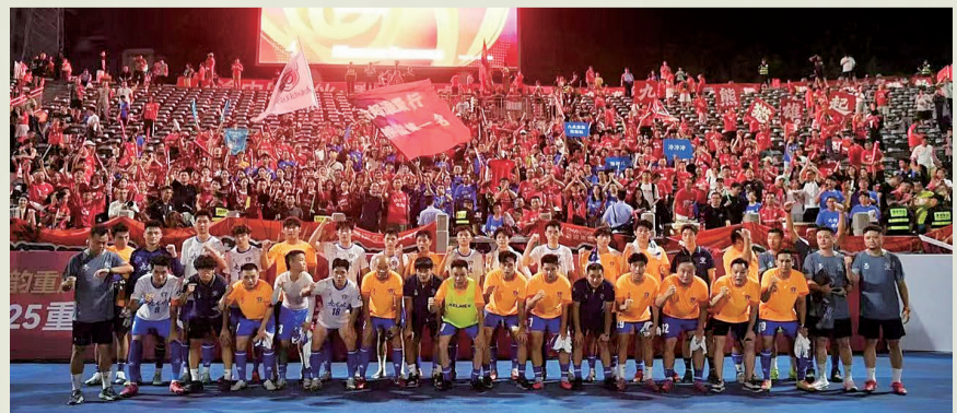
9月13日晚，“渝超”揭幕战现场。