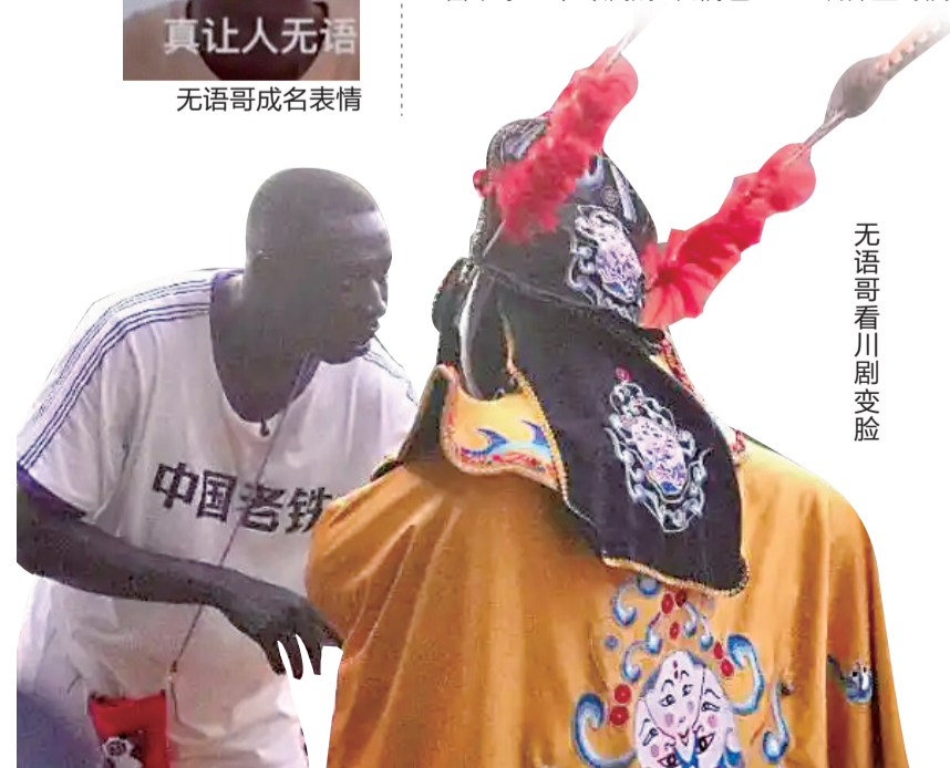
无语哥看川剧变脸