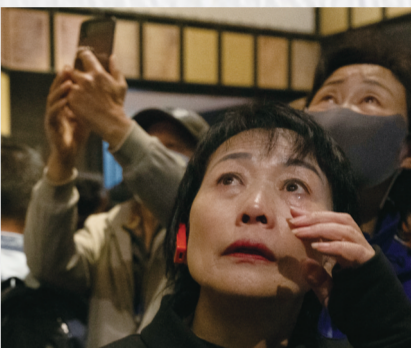
9月18日,一名参观者在侵华日军第七三一部队罪证陈列馆落泪。