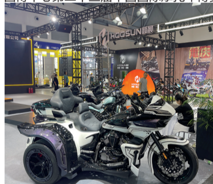
国博中心第二十三届中国国际摩托车博览会会场,展示的各种不同风格和技术的摩托车。