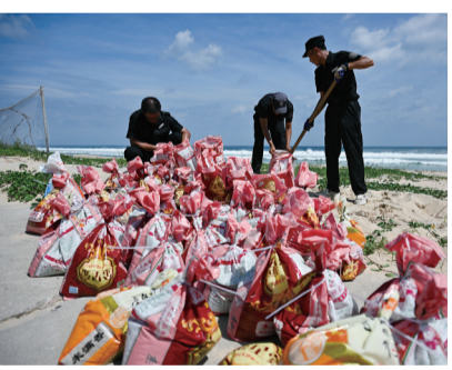
酒店工作人员正在填装沙袋