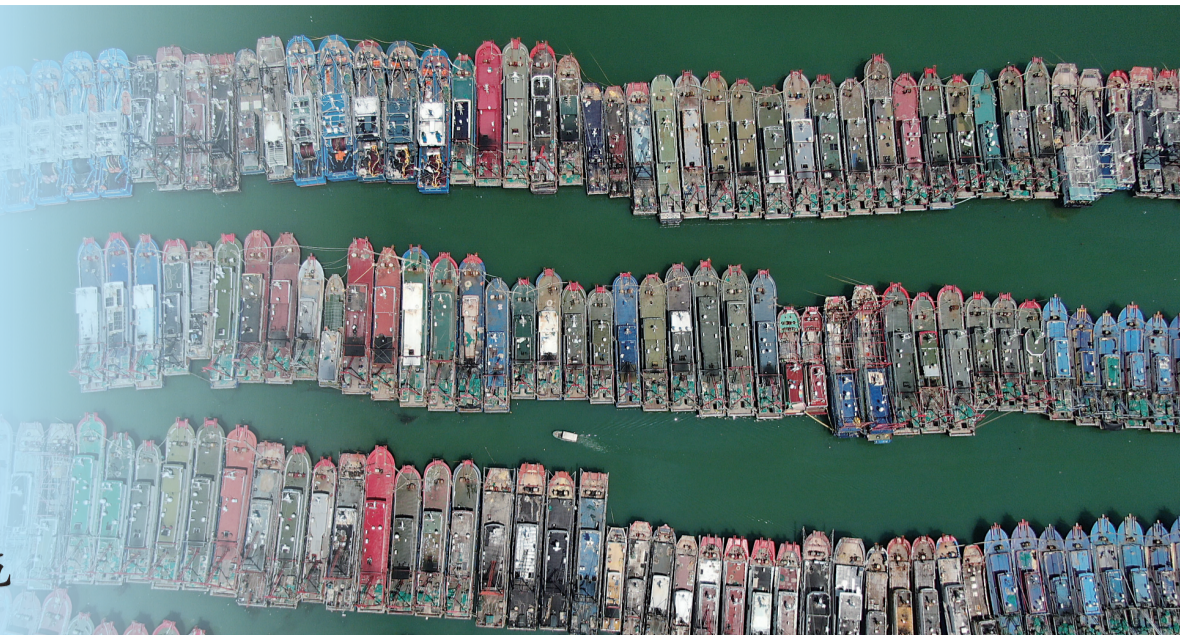
9月23日,广东阳江市海陵岛闸坡国家中心渔港停满了归港避风的渔船