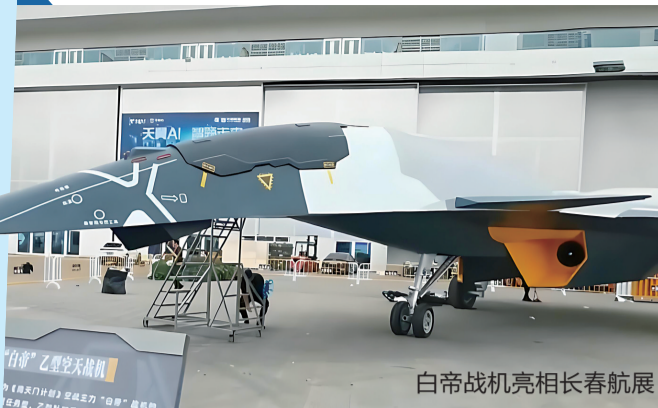
白帝战机亮相长春航展