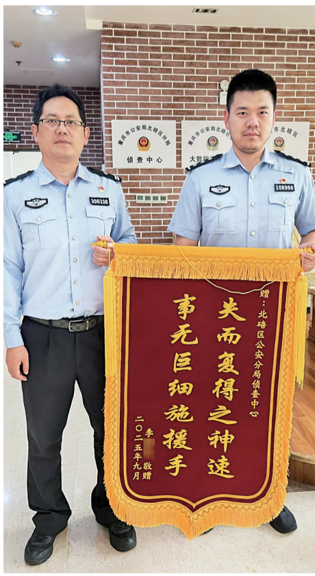
云南曲靖寄来的锦旗