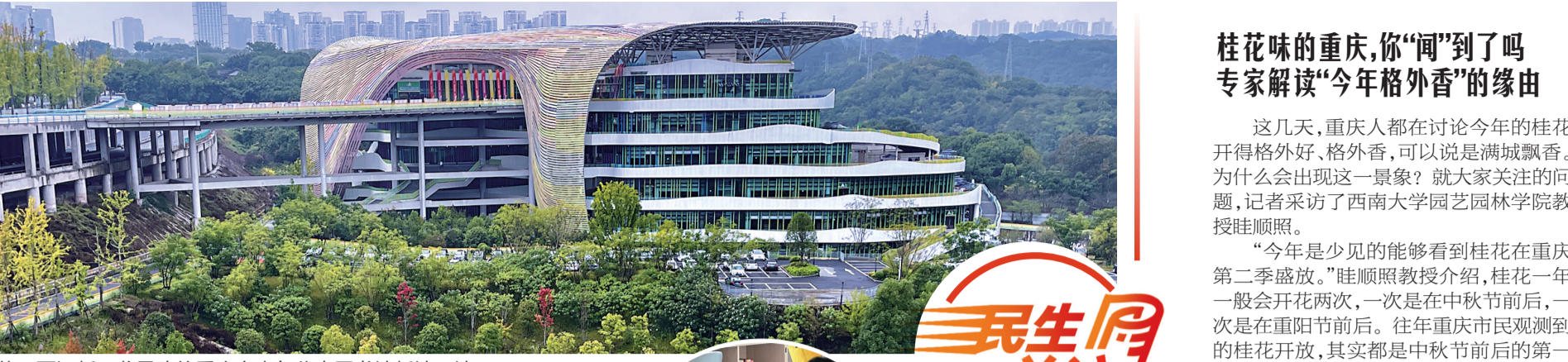
位于两江新区龙景路的重庆市少年儿童图书馆新馆开馆