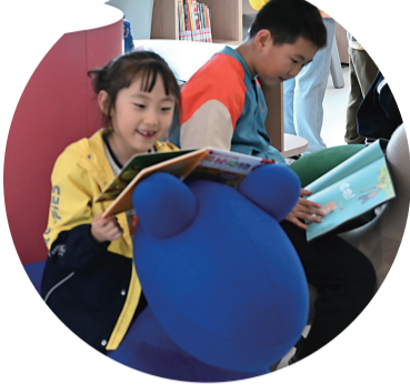
孩子们在市少儿图书馆新馆

11月1日，重庆市少年儿童图书馆新馆开馆暨少儿阅读推广成果展在两江新区龙景路新馆举行。作为我市“十四五”时期文化强国建设的重要民生工程，市少儿图书馆新馆以“全国一流、西部领先”为目标，是市打造的集“阅读、体验、活动、信息、培训、收藏”于一体的智慧型少儿阅读新地标。