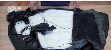
电加热带线路布设比较混乱