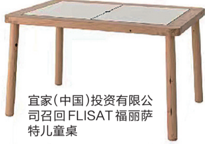
宜家(中国)投资有限公司召回FLISAT福丽萨特儿童桌