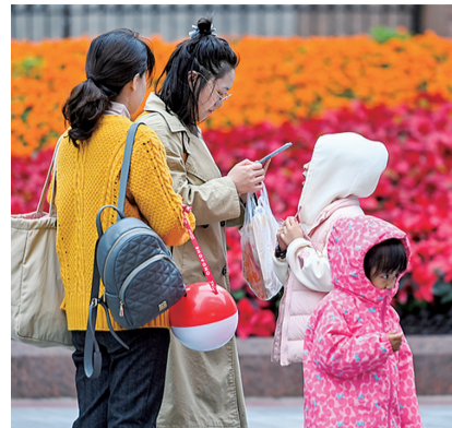
近日降温,部分市民穿上了羽绒服。

根据重庆市气象台昨日预计,未来三天重庆市以晴到多云为主,昼夜温差较大,坪坝河谷地区早上有雾。市内最高气温19℃。