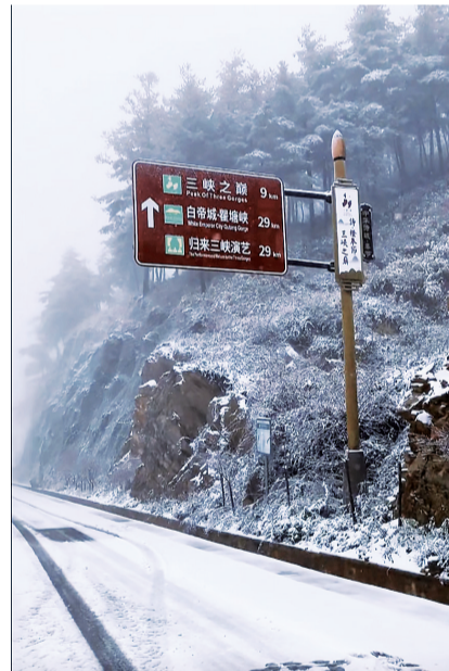
三峡之巅路面上的积雪(视频截图)

11月17日,奉节有游客发帖称,自己在前往三峡之巅景区的途中拍到突降大雪的视频。视频显示,道路和两侧树木已被白雪覆盖,能见度明显降低,沿途景点的指示牌周围也积起了薄雪。有游客在评论区留言称,前几天上山时还穿着短袖,如今骤降大雪,“天气变化真是太魔幻了!”