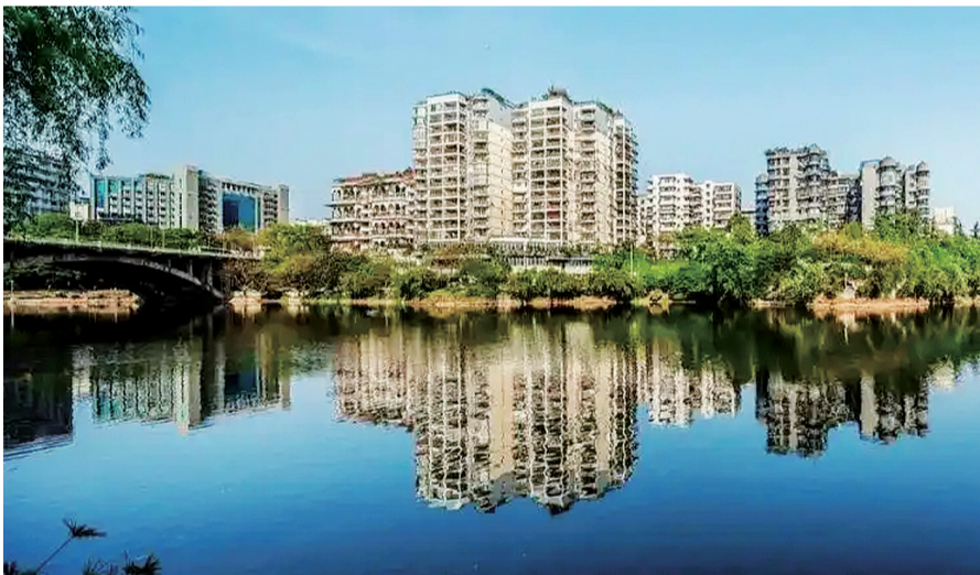
双龙湖临空片区城市更新功能品质提升项目一角