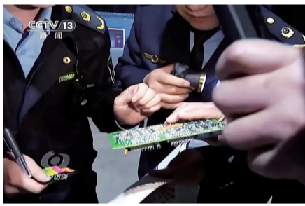
查获用于作弊的主板