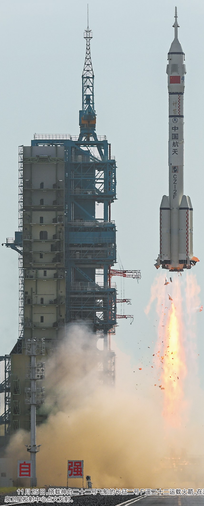
11月25日,搭载神舟二十二号飞船的长征二号F遥二十二运载火箭,在酒泉卫星发射中心点火发射。

2025年11月25日12时11分,搭载神舟二十二号飞船的长征二号F遥二十二运载火箭,在酒泉卫星发射中心点火发射,约10分钟后,飞船与火箭成功分离并进入预定轨道,发射任务取得圆满成功。这是中国载人航天工程第1次应急发射任务。 神舟二十二号飞船入轨后顺利完成状态设置,于11月25日15时50分成功对接于空间站天和核心舱前向端口。交会对接完成后,神舟二十二号飞船将转入组合体停靠段,后续将作为神舟二十一号航天员乘组的返回飞船。 目前,神舟二十一号航天员乘组在轨状态良好,正在按计划完成各项既定工作。神舟二十号飞船将继续留轨开展相关试验。