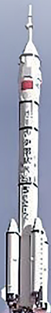
搭载神舟三十号载人飞船的长征二号F遥三十运载火箭发射