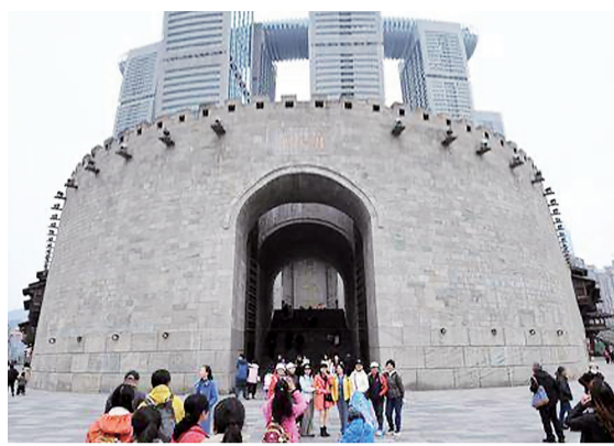
游客在修葺一新的朝天门码头城门前游览

12月7日,记者从市住房和城乡建设委获悉,备受市民关注和期待的朝天门广场及两江汇滨江步道近日改造完成,已对广大市民和游客开放。上周末天气晴好,吸引不少市民前来打卡。