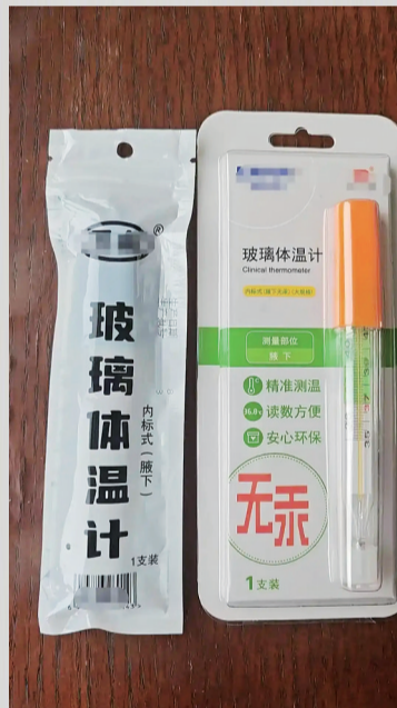
店员向记者介绍的无汞玻璃体温计无毒环保，不惧破损。

一位三甲医院医务人员表示，对家庭场景中的病情诊断，使用电子体温计或无汞玻璃体温计已完全足够，公众没必要囤积抢购水银体温计。