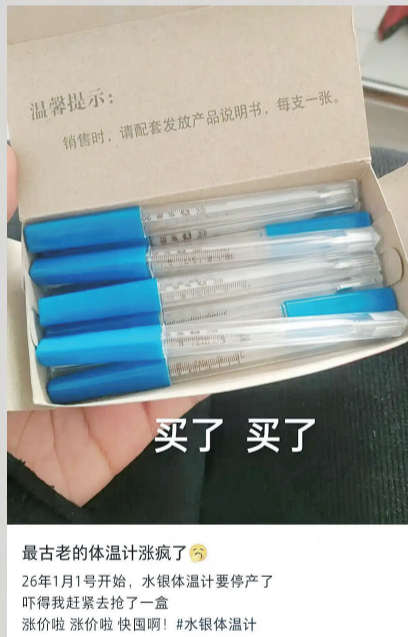
博主晒出水银体温计的照片 社交平台截图