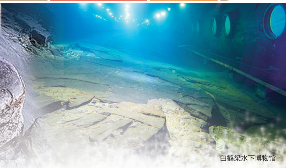
白鹤梁水下博物馆

白鹤梁保留自唐代至民国一百多幅石刻题记，现存石鱼十四组18尾，最大的一尾长2.8米、宽1米多，重约三吨半——