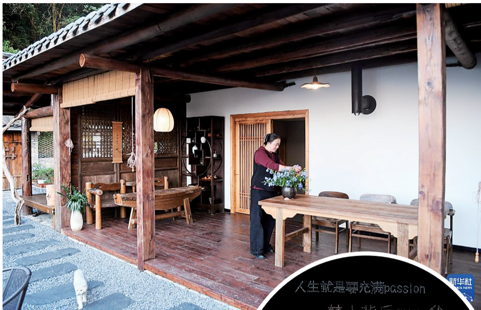
北碚区澄江镇一民宿工作人员在整理鲜花

设置专属烟花区,并赠送跨年热红酒。许多民宿自发组织零点倒计时活动、准备派对道具,将民宿特有的烟火气与人情味,塑造成为跨年记忆中不可替代的一部分。