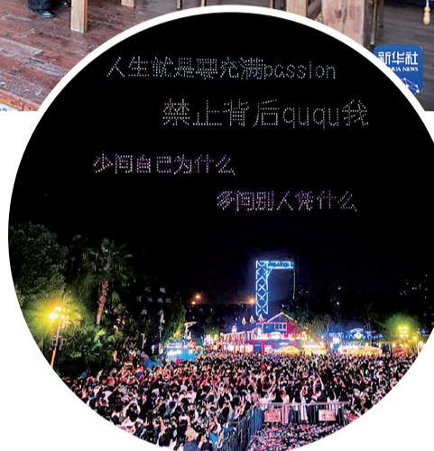
欢乐谷往期活动现场

面对即将到来的客流高峰,重庆一些景区提前布局,围绕“暖冬”与“仪式感”打造差异化体验产品。以涪陵美心红酒小镇为例,景区依托“高峡平湖”的生态优势,推出“住宿+暖景”,将景区江景房升级为“围炉煮茶”套餐,游客可在观景阳台煮茶品茗,静赏冬日江天一色。还推出“饮品+暖聚”组合,七侠广场创新推出“围炉煮酒”,将自酿啤酒与红枣、枸杞等食材共煮,打造风味独特的暖冬社交饮品。最后是“场景+狂欢”,景区古堡民宿开设跨年派对专场,融合音乐、互动游戏