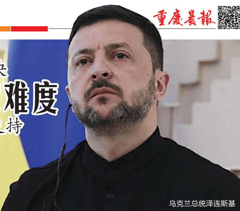
乌克兰总统泽连斯基

当地时间12月15日，美国代表与乌克兰总统泽连斯基就“和平协议”在德国柏林举行的新一轮会谈结束，此前一天，相关各方也进行了长达五小时的磋商。会后，美乌代表均表态，此次会谈“富有成效，取得重大进展”。特朗普更是表示，现在比以往任何时候都更接近达成实现俄乌和平的“和平协议”。 虽然这次美乌会谈在多个关键议题上已形成初步共识，但最棘手的领土问题依旧未能解决，作为另一个当事方的俄罗斯能否会同意“和平协议”一切都还是未知数。