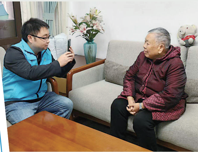
工作人员上门为高龄老人办理认证