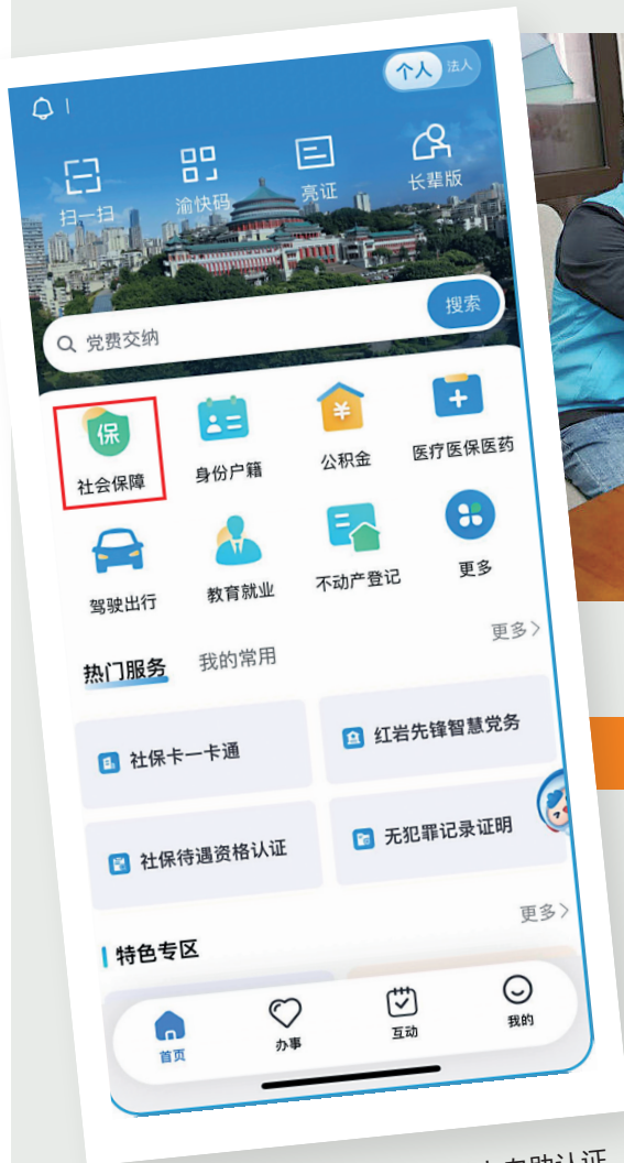
市民可在线上自助认证

其中,若要进行线上“自助认证”,群众只需登录“渝快办”APP,通过“居民待遇权益资格综合认证”功能模块,选择相关待遇权益事项,进行人脸识别后,即可一次性完成多项认证,无需到现场办理。