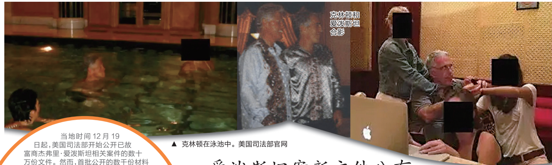
克林顿和爱泼斯坦合影