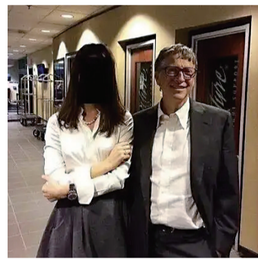
▲ 比尔·盖茨和一名女子在酒店走廊里同框

最后，关键证据的缺失仍是黑洞。关于爱泼斯坦可能用于勒索的“客户名单”，其狱中死亡完整的监控录像，以及更深层的司法徇私包庇记录，在此次公布中依然无踪。司法部曾于今年7月发布备忘录，断定无可信证据证明存在此类名单或谋杀，并一度宣称不再公布更多文件，直到被国会立法强制扭转。