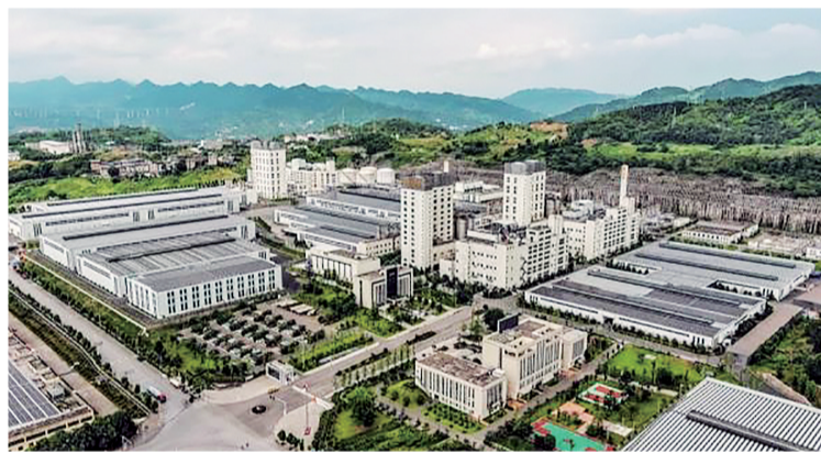
重庆万凯新材料科技有限公司全貌

轻干部挂职锻炼,让他们有机会学习借鉴浙江在大数据、智能化、乡村振兴、文化旅游等方面的经验、做法。据统计,20多年来,浙江累计接收涪陵优秀年轻干部挂职锻炼397人,挂职干部所在单位与挂职地区相关单位交流互访超3000次。其间,浙江、涪陵还经常协同开展人才培训工作,包括“移民技能培训”“移民干部培训”“移民致富带头人培训”等。