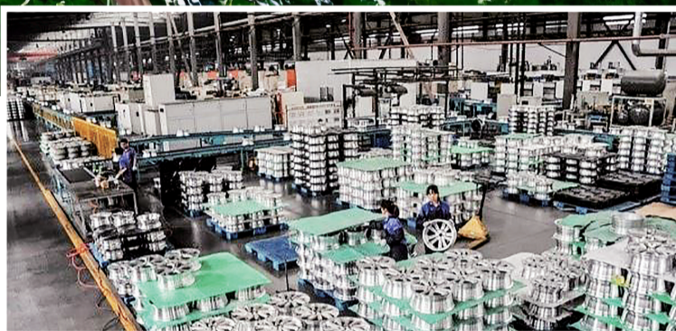
重庆万丰奥威铝业有限公司生产车间

在智力帮扶上,浙江创新对口支援人才培养模式,大力支持“涪陵百万三峡人才”培养工程(百名党政领导干部、千名专业技术人才、万名移民致富能手)。20多年来,浙江每年接收一批涪陵的优秀年