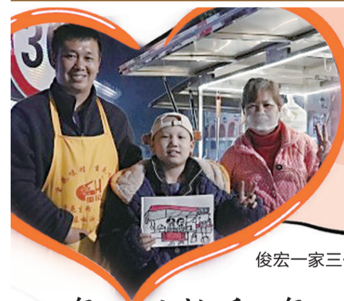
俊宏一家三代人在小吃摊前