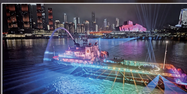
表演船参与光影水秀表演