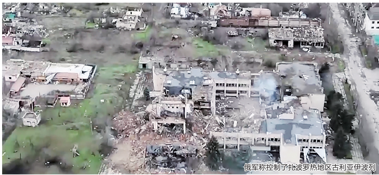
俄军称控制了扎波罗热地区古利亚伊波列