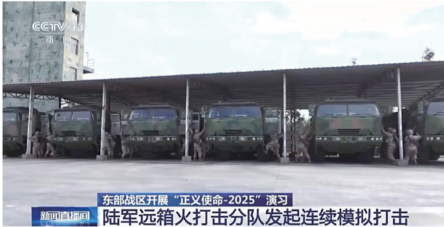
东部战区开展“正义使命-2025”演习 陆军远箱火打击分队发起连续模拟打击