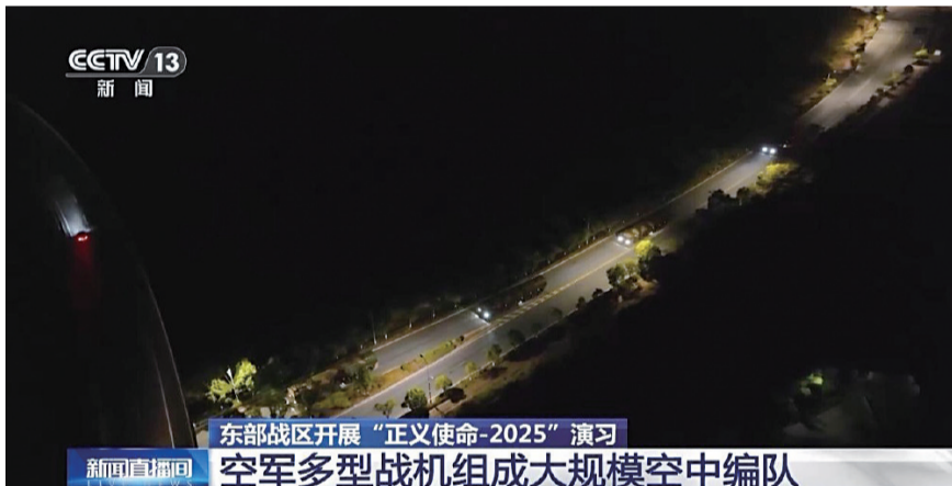
东部战区开展“正义使命-2025”演习 空军多型战机组成大规模空中编队

29日，国务院台办发言人陈斌华表示，解放军有关军事行动是对“台独”分裂势力和外部干涉势力的严正警告，是捍卫国家主权和领土完整的必要、正义之举。赖清德当局搞“台独”分裂活动，无原则媚外、无底线卖台，不惜牺牲台湾经济发展和民生福利，在勾连外部势力谋“独”挑衅、穷兵黩武的邪路上狂奔，严重破坏两岸关系，严重威胁台海和平稳定，严重损害中华民族根本利益和台湾同胞切身利益。对于任何“台独”分裂行径，我们决不容忍、决不姑息，必将痛击。