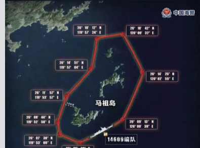
福建海警舰艇编队 位马祖岛附近海域执法巡查示意图

29日，福建海警组织舰艇编队位台岛周边邻近海域开展执法巡查，实施联合护渔、查证识别、拦截查扣等科目演练，检验了有效管控、高效执法能力。