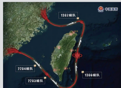
海警舰艇编队 按一个中国原则环台岛执法巡查