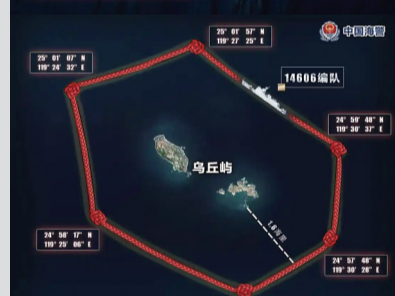
福建海警舰艇编队 位乌丘屿附近海域执法巡查示意图