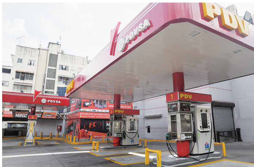
1月3日，在委内瑞拉一家委内瑞拉石油公司的加油站关闭。