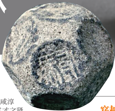
秦始皇陵园寝殿偏殿出土14面的“石博苺”

那这些特殊的骰子究竟是用于什么游戏呢？它点数的独特之处，或许是解开某个特定游戏的关键。