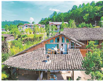
双城村新改建的民宿