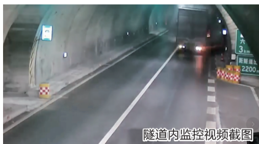
隧道内监控视频截图

同时，该路段运行监测调度总中心通过24小时视频监控与感温光纤火灾报警系统，几乎同时确认了异常。4时17分，运行监测调度总中心发