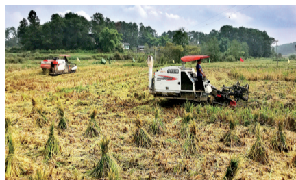
涪陵市乡村丰收美景

1月6日，记者从市农业农村委获悉，农业农村部当天公示的2025年国家乡村振兴示范县创建名单，北京市顺义区、天津市滨海新区等83个申报单位入选，我市北碚区和涪陵区榜上有名。