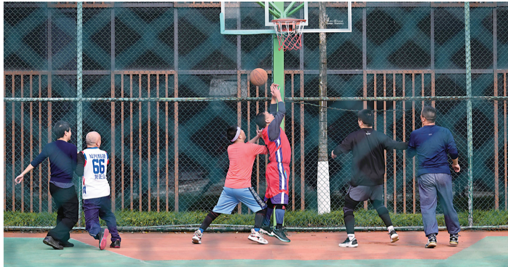
市民在篮球场竞技

昨日,记者从重庆市气候中心获悉,最新气象数据显示,重庆中心城区,终于在2026年1月1日正式入冬。