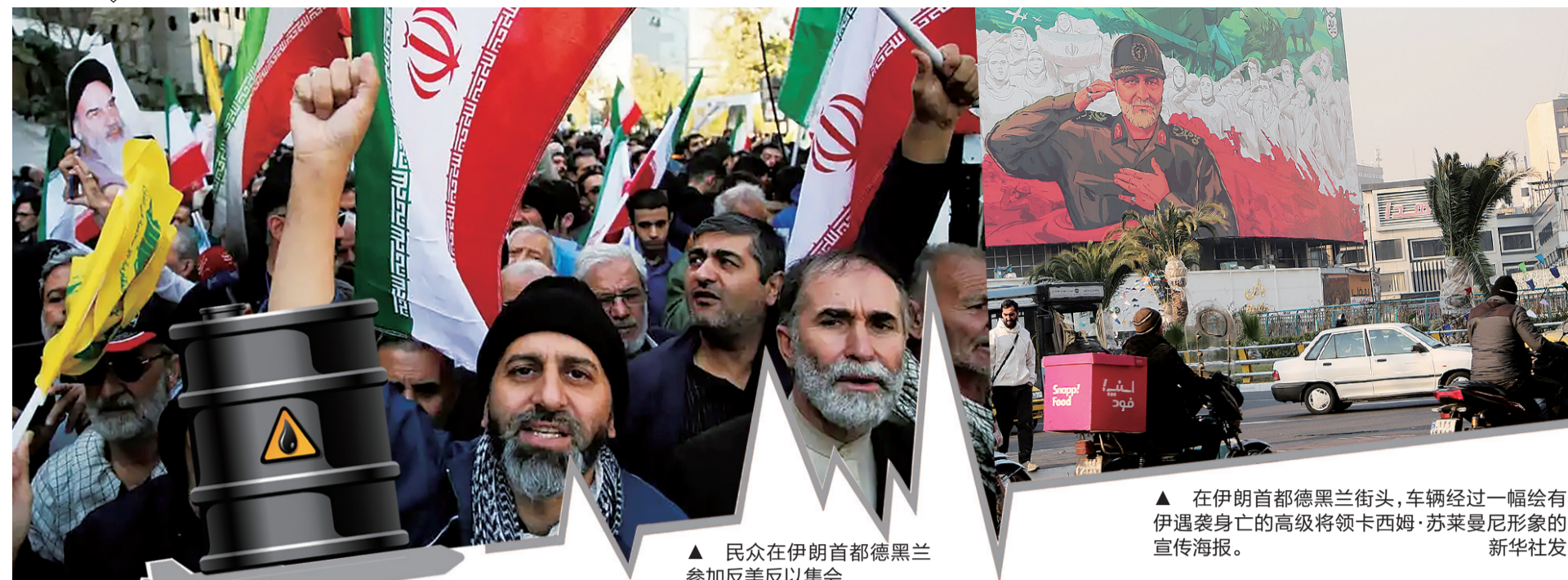
▲ 民众在伊朗首都德黑兰参加反美反以集会