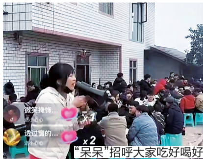
“呆呆”招呼大家吃好喝好

截至记者发稿的12日晚上7点半，仍有上千网友汇集在庆福村“呆呆”家门前的空地上举行篝火晚会，“呆呆”由于连续3天坚持，体力严重透支，在直播中透过她的朋友宣布，这次家里杀年猪，出乎意料的热闹和成功，感谢广大网友的支持和热情，所有活动都将在12日晚上结束。但村里还有其他乡亲邻居家要杀年猪，但不知道会不会接待网友，希望想要到庆福村玩儿的网友，事先和当地取得联系。