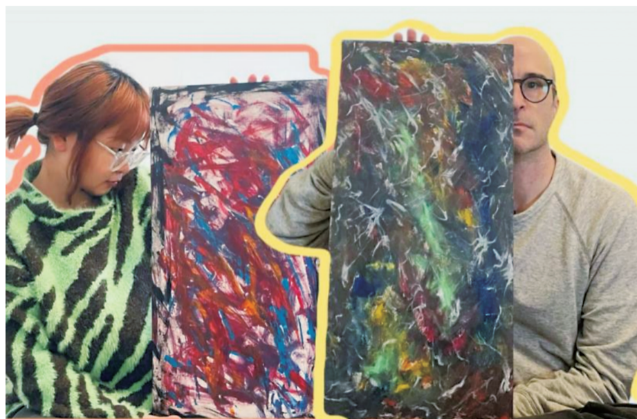
亚当夫妇街头体验涂鸦创作

文字:林禹衡 蔡怡 罗玲 汪思齐 指导老师:刘丹凌 总策划:刘丹凌 郭小安 汤寒锋